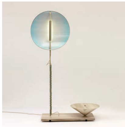
“MAKOTO” (Reflection Lamp) La vérité , 2013 6 exemplaires + 2 E.A. + 1 prototype 230 cm x 150 cm x 50 cm