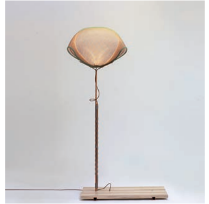
“MEIYO” (Mesh Lamp) L'honneur , 2013 6 exemplaires + 2 E.A. + 1 prototype 225 cm x 120 cm x 70 cm