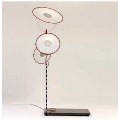
“REI” (Shields Lamp) La bonne action , 2013 6 exemplaires + 2 E.A. + 1 prototype 240 cm x 150 cm x 90 cm