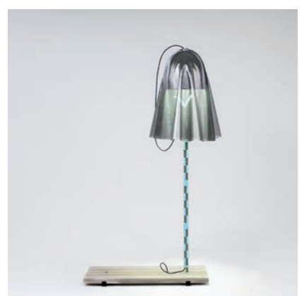
“JIN” (Fabric Lamp) La compassion , 2013 6 exemplaires + 2 E.A. + 1 prototype 210 cm x 130 cm x 60 cm