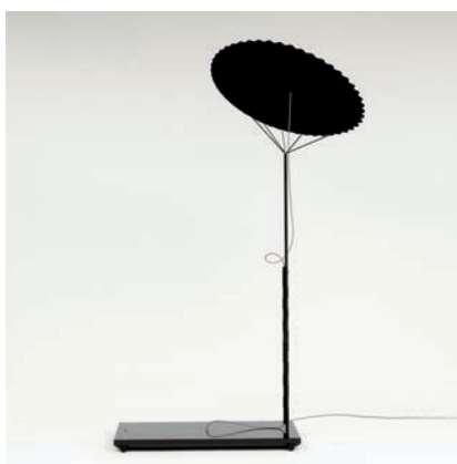
“CHUUGI” (Black Hole Lamp) Devotion , 2013 6 exemplaires + 2 A.P. + 1 prototype 240 cm x 160 cm x 80 cm