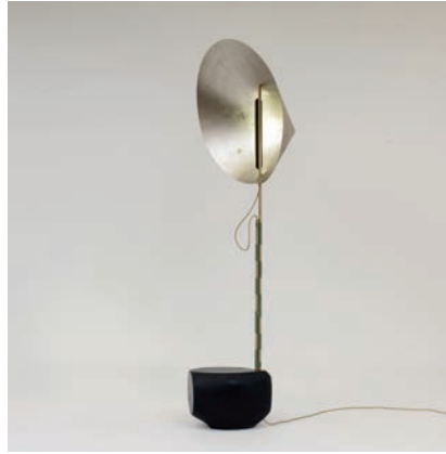
“YUU” (Mirror Lamp) La bravoure , 2013 6 exemplaires + 2 E.A. + 1 prototype 240 cm x 90 cm x 60 cm