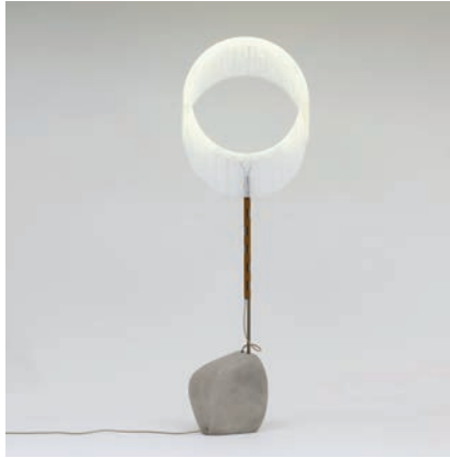
“GI” (Cord Lamp) La bonne décision , 2013 6 exemplaires + 2 E.A. + 1 prototype 245 cm x 80 cm x 33 cm