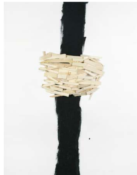
Tadashi Kawamata, Site sketch n°272, 2019