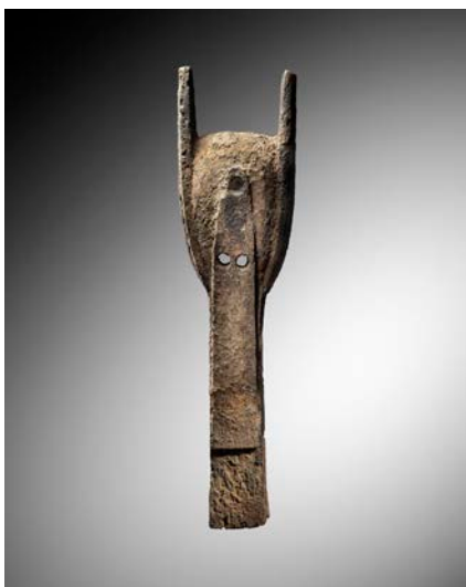
Masque Bambara, Mali