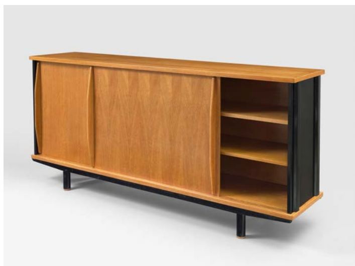
Jean Prouvé, Bahut n°150, circa 1950